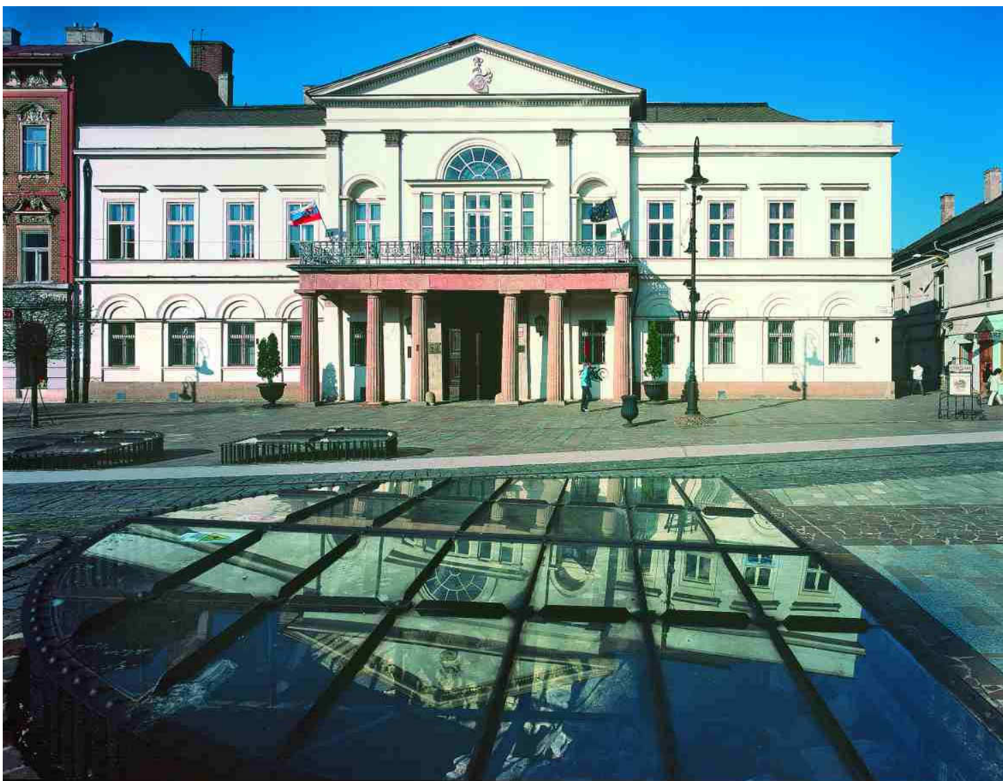
hlavná budova knihnice - centrum