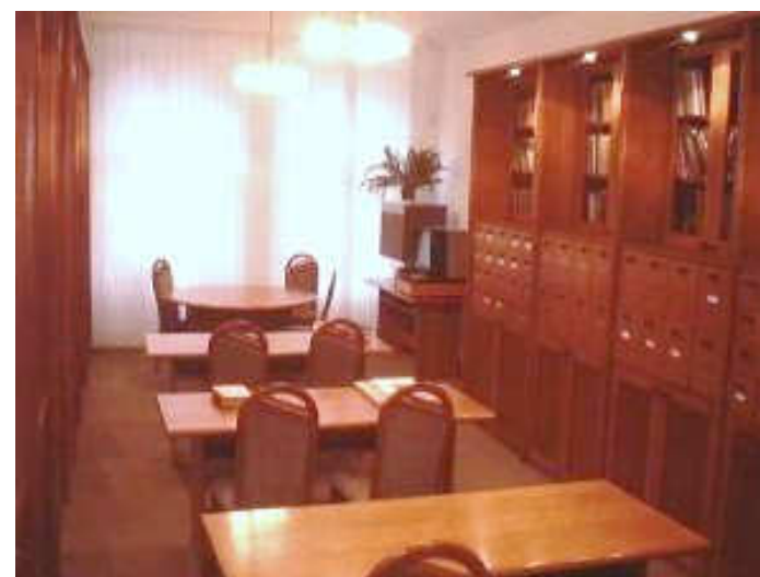
budova knižnice Pribinova ul., dolu nemecká knižnica;