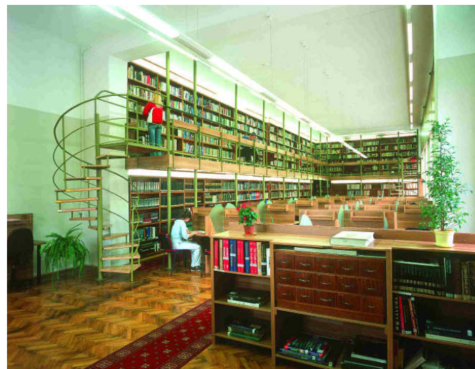
1. zhora hlavná pižičovňa – Britské centrum – InfoUSA – všeobecná študovňa kníh