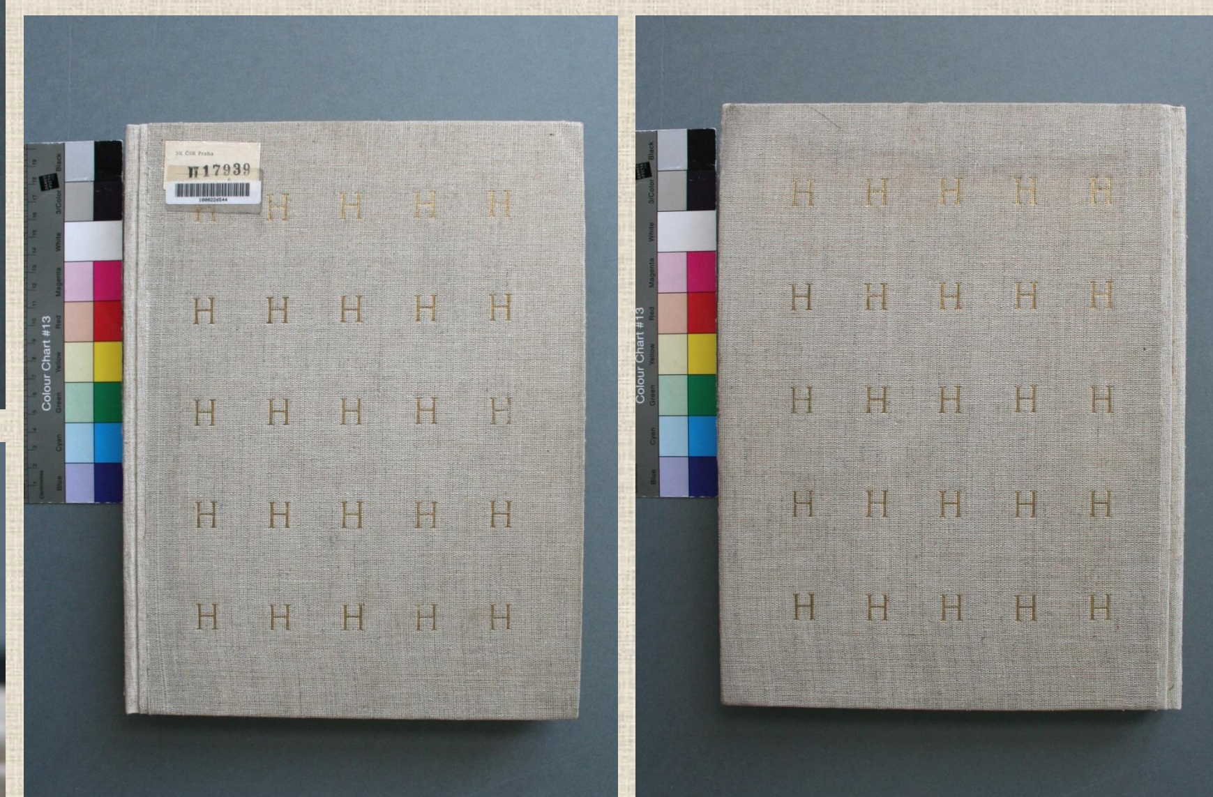
stav po restaurování