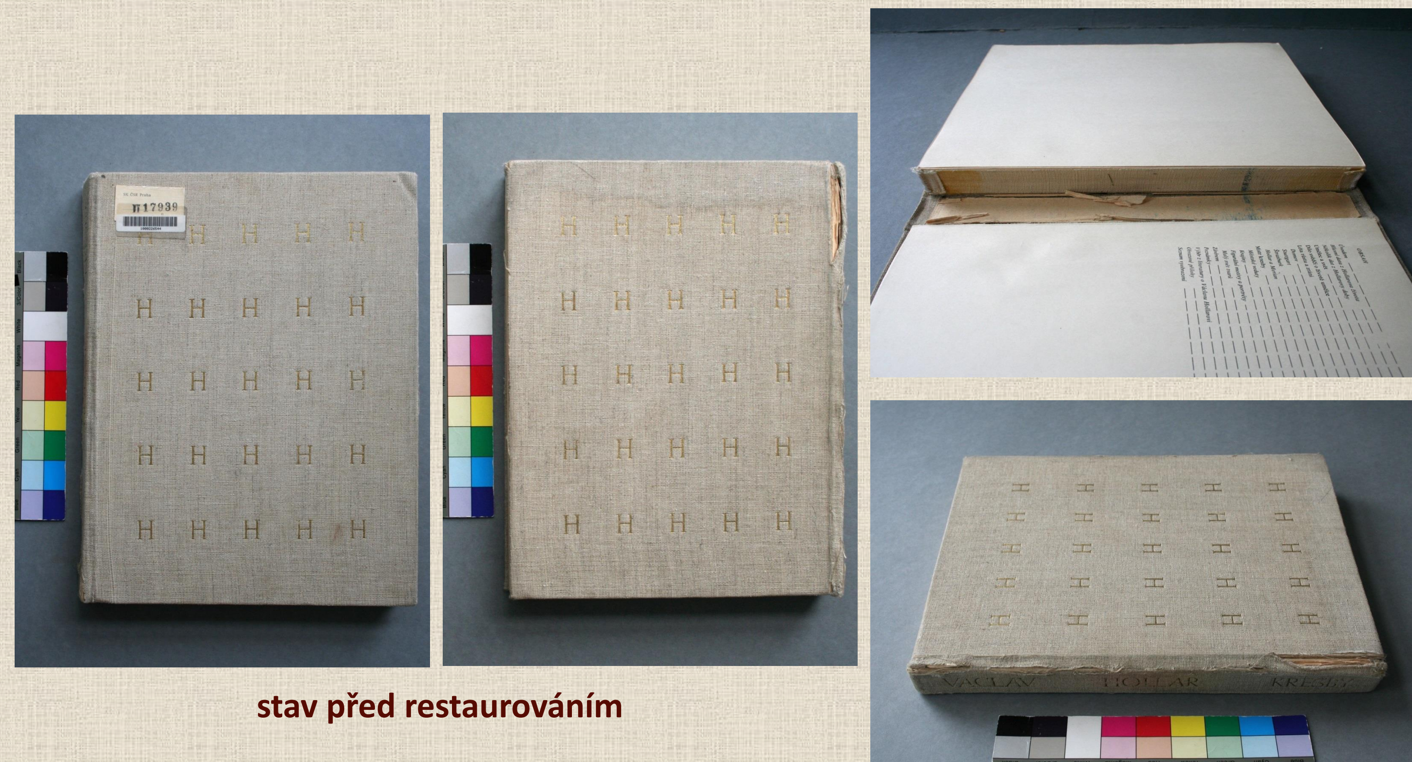
stav před restaurováním

Plátno bylo v zadní drážce prasklé téměř po celé délce hřbetu a z přední strany ztratilo svou pevnost vlivem vyspání zátěru. Lepený knižní blok držel pouze na jedné předsádce, lepení bylo prasklé na více místech. Rohy desek byly zdeformované a potah byl poškozený.