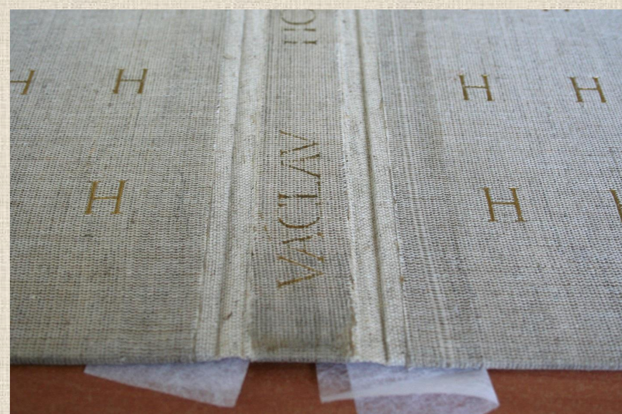
stav v průběhu restaurování