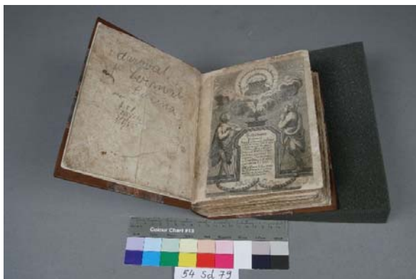
Restaurování starého tisku a jeho příprava pro digitalizaci.