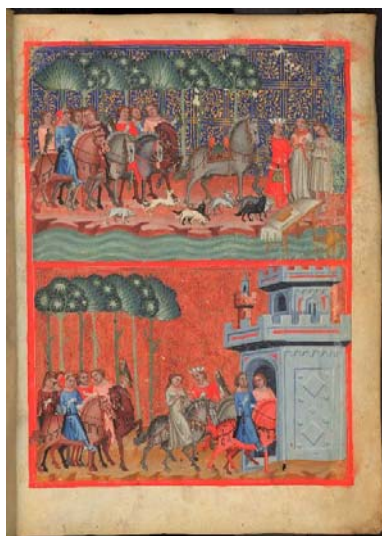
Pařížský zlomek Dalimilovy kroniky – digitalizovaná podoba.